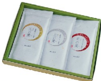
7 天の葉・光の葉・彩の葉 詰合わせ