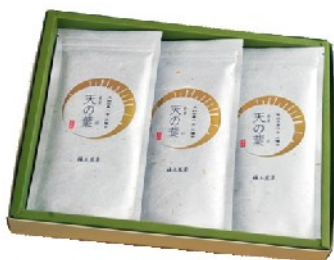
6 天の葉 3本詰合わせ