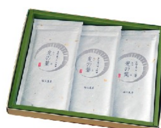
8 光の葉 3本詰合わせ